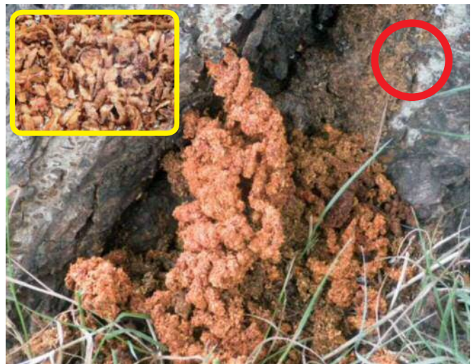
クビアカツヤカミキリの幼虫が出すフラス 枠内・指ですりつぶしてルーペで見ると、繊維質が無い