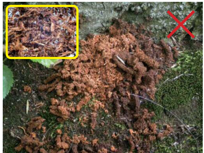
良く似たフラス（他のカミキリ） 枠内・指ですりつぶしてルーペで見ると、繊維質が多い