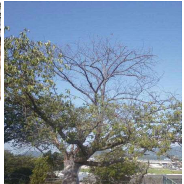
枝の一部が枯れたサクラ 被害初期は一部の枝が枯れることが多い