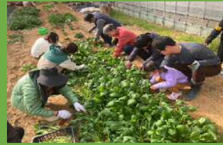
ビニルハウスでの栽培も