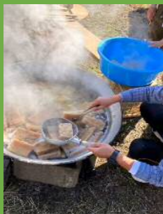
冬の恒例・ こんにゃくづくり