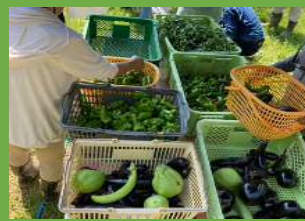
野菜をみんなでシェア