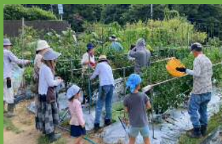
大人も子供も一緒に