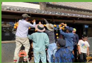
秋の味覚・吊るし柿づくり