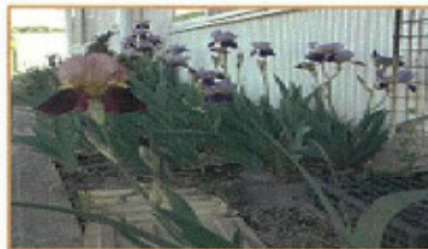
ジャーマンアイリス