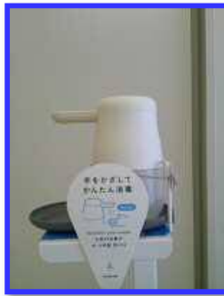
手をかざすと自動で消毒