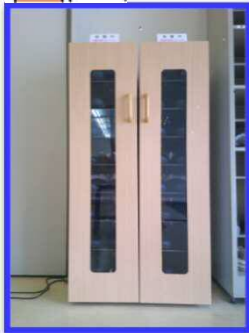
除菌スリッパボックス