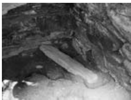
▲石室から見つかった石柵材

この石柵、調査後そのまま埋め戻されていますが、近い将来、多くの人が見て触れるように展示できればいいなあ、と思います。