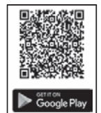
▲ Android をお使いの人