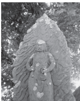
▲北六田の柳を傘に 石不動

次号も、町内の大字ごとに各区の特徴を織り交ぜながら、大淀町内の各地域について概観していきます。