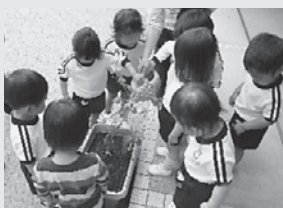
▲菜園活動の様子 (あおぞら保育所)