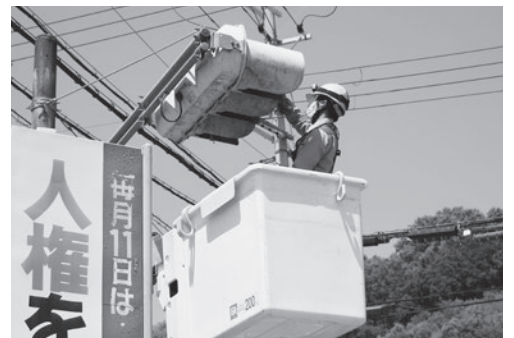
▲信号機清掃の様子

現場には、町マスコットキャラクターよどりちゃんも駆けつけ、きれいになった信号機を見て喜んでいました。