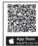
▲ iPhone をお使いの人

さんあーるは、ごみの分別方法を手軽に検索したり、ごみの収集日を通知したりできる便利なアプリです。 ※ 利用料は無料ですが、通信料がかかります。