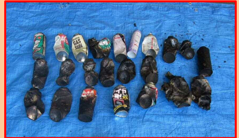
↑ 火災原因と思われるカセットボンベ等