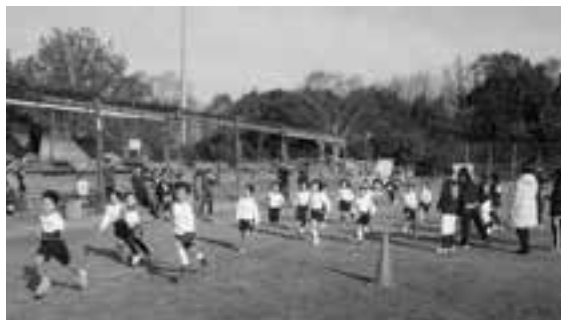
▲マラソン大会の様子

12月16日(日)、町平畑運動公園サッカー場および周辺道路で町スポーツ少年団冬季マラソン大会が開催されました。参加した小学生ランナー70人は、見守る保護者や友人らの声援に後押しされながら、寒さに負けず元気いっぱいゴールをめざしました。