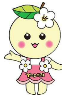
大淀町マスコットキャラクター よどりちゃん