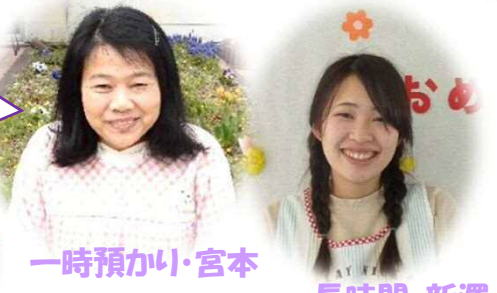
一時預かり・宮本

あおぞら保育所のお友達みんなといっぱい遊んで仲良くしたいです♪ 一時預かり保育士 長時間保育士